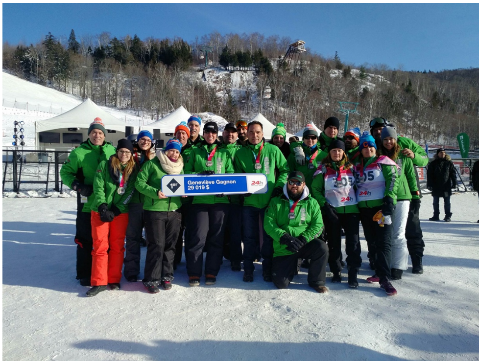
Les 20 skieurs et marcheurs de l'équipe BMR Groupe Yves Gagnon